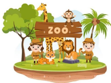
« Le Zoo de St Derrien »

Lundi 23 : Tableaux aux couleurs des animaux de la savane