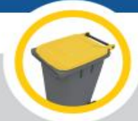
POUBELLE COUVERCLE JAUNE