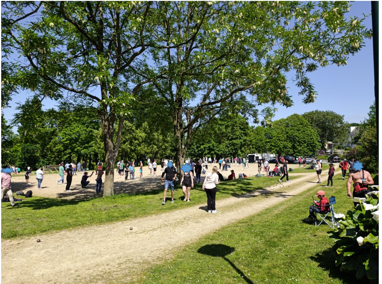
Le dimanche 18 mai a eu lieu le concours de pétanque qui a rassemblait 87 équipes !une belle réussite avec le soleil en prime